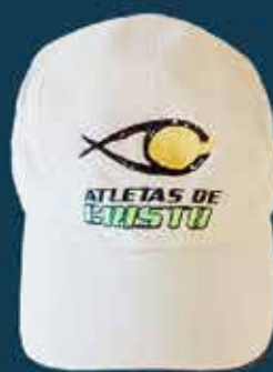
Boné Atletas de Cristo