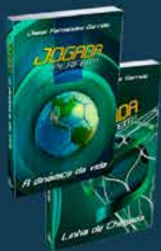
Livro Devocional Jogada Perfeita

Adquira a nova camiseta Atletas de Cristo em nossa loja virtual