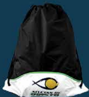
Mochila Atletas de Cristo